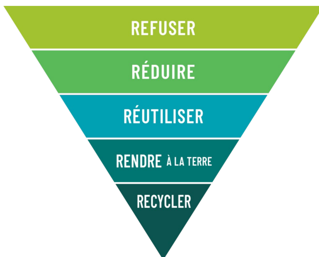
2305 Figure 2: CC-BY-SA 2 - Zero Waste Paris

Les 5R expriment des priorités à appliquer dans l'ordre. On refuse ce dont on n'a pas besoin, on réduit ce dont on a besoin, on réutilise ce qui peut l'être, on composte les matières organiques (« rendre à la terre ») et on recycle les matières qu'on ne peut ni réutiliser ni composter.